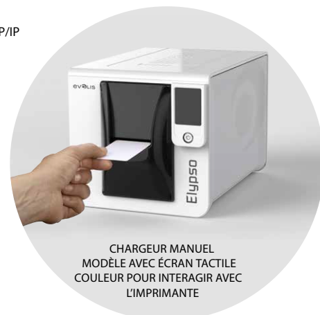
CHARGEUR MANUEL MODÈLE AVEC ÉCRAN TACTILE COULEUR POUR INTERAGIR AVEC L'IMPRIMANTE